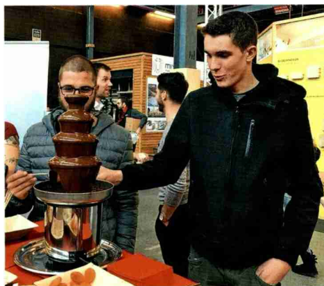
← ↑ Stand de la FRECEM avec sa fontaine en chocolat

tandis que la dégustation de son organisée par JMC Lutherie SA a donné la possibilité au public de découvrir les propriétés étonnantes du bois de résonance. Durant le weekend, les enfants ont été nombreux à s'initier au travail du bois en participant à un atelier de fabrication de mangeoires à oiseaux, avec le concours des apprentis charpentiers de l'EPAC de Bulle, encadrés par le comité GFC (Groupement fribougeois des charpentiers). ■